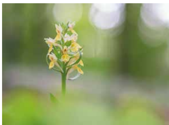
Orchidea Dactylorhiza romana