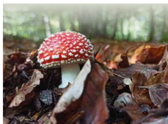
Ovolo malefico ( Amanita muscaria )