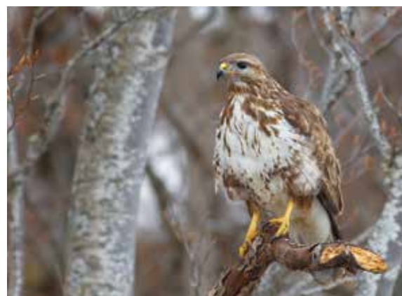
Poiana ( Buteo buteo )