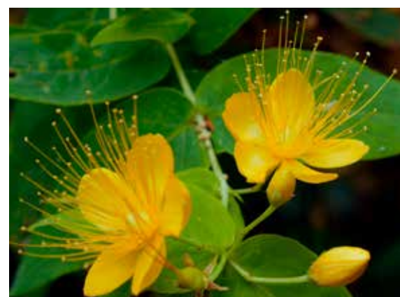
Hypericum androsaemum