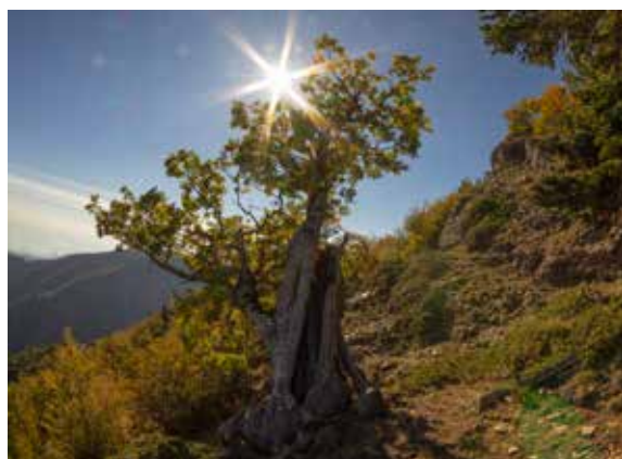
Quercia ( Quercus )