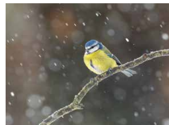
Cinciarella ( Cyanistes caeruleus )