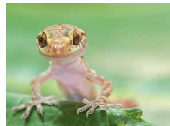
Geco comune ( Tarentola mauritanica )