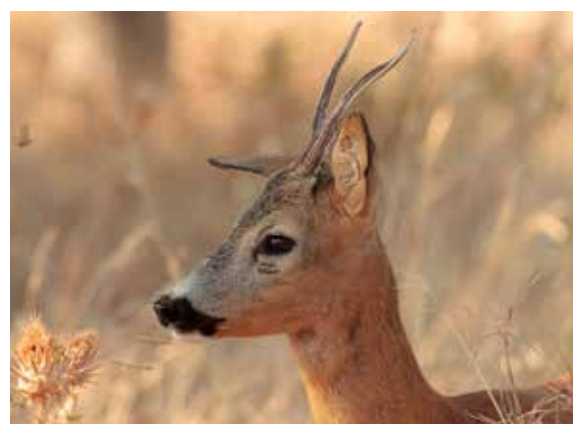
Capriolo ( Capreolus capreolus )