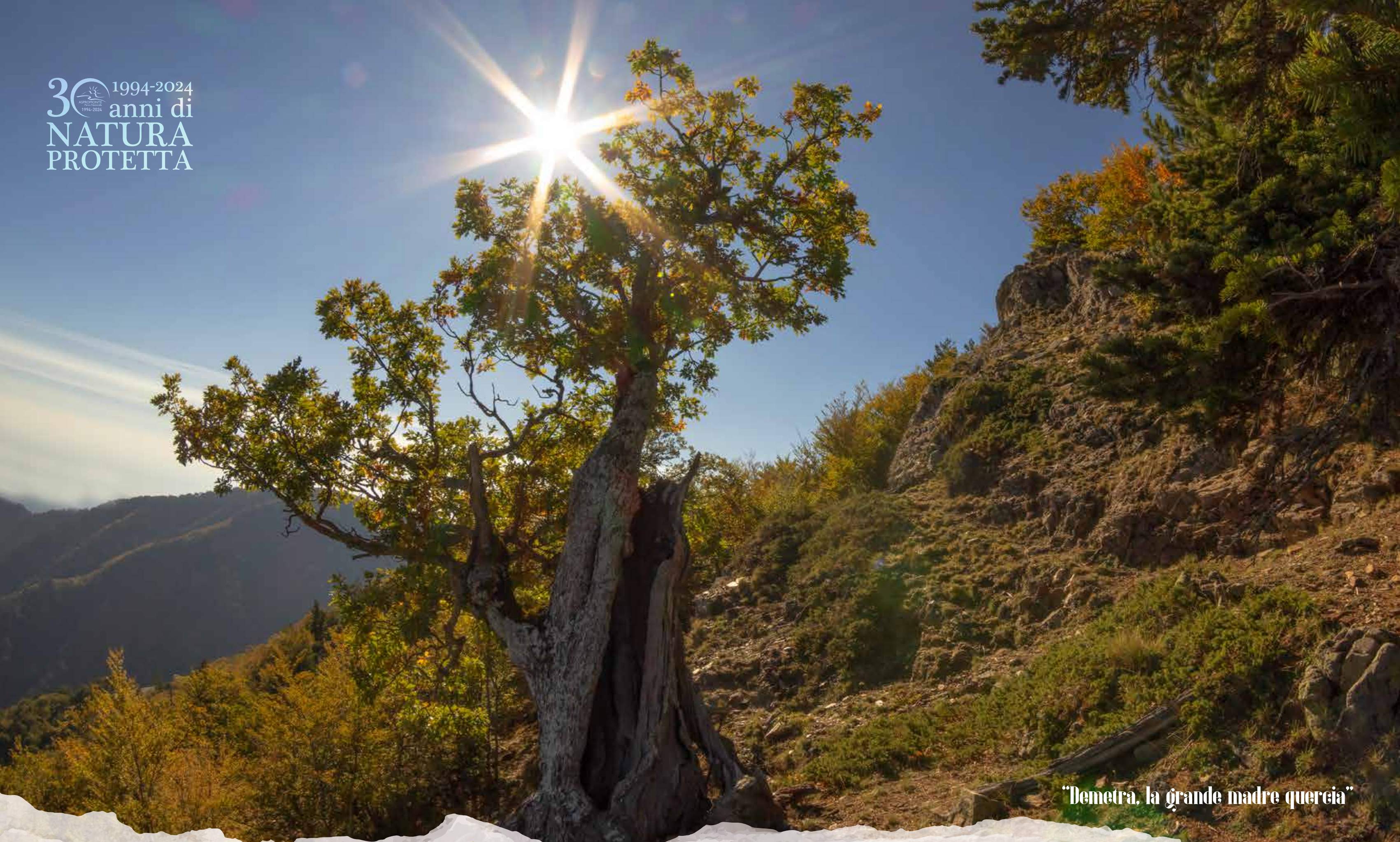
“Demetra, la grande madre quercia”