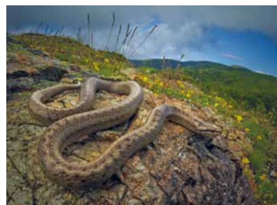
Colubro liscio ( Coronella Austriaca )