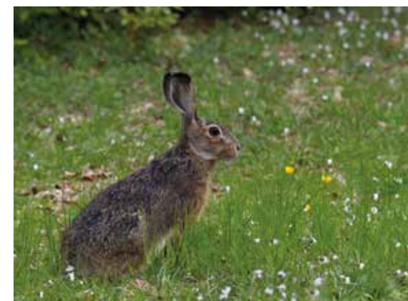
Lepre Italica ( Lepus corsicanus )