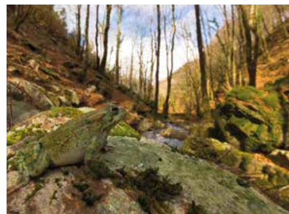
Rospo Smeraldino ( Bufo viridis )