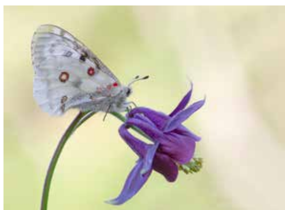
Farfalla apollo ( Parnassius apollo )